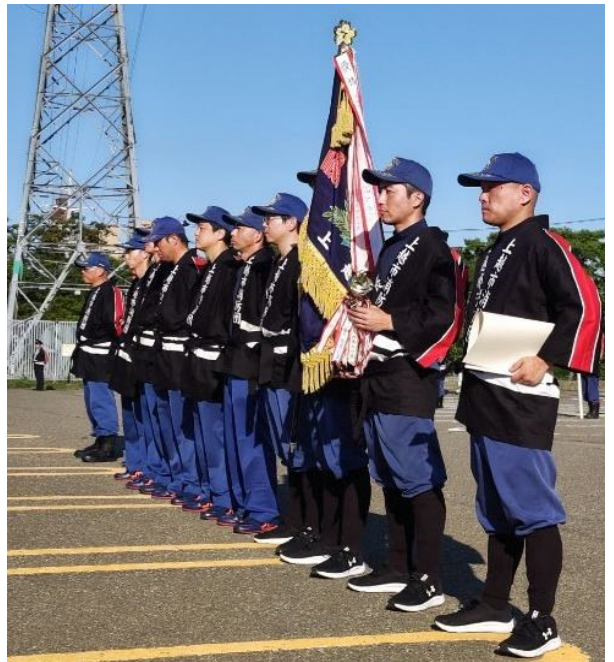
優勝旗を手に整列する上杉分団

上杉分団は、8月6日に見附市で開催される新潟県消防大会操法競技会に、上越市消防団を代表して出場します。引き続き、地域の皆様の応援をお願いします。